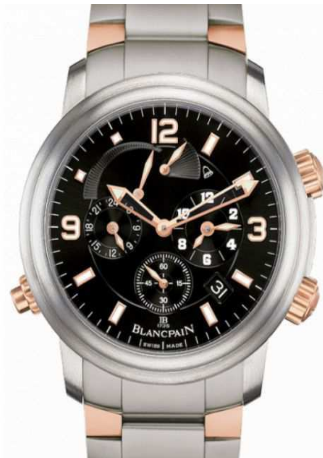
LEMAN Reveil GMT 2041 12A30 98A