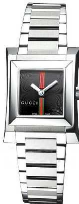
GUCCIO YA111502 Cuarzo- Acero VENDIDO