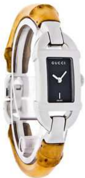
BAMBOO YA068514 Cuarzo - Acero/Bambú