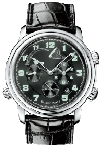
LEMAN Reveil GMT 2041 1130 53B