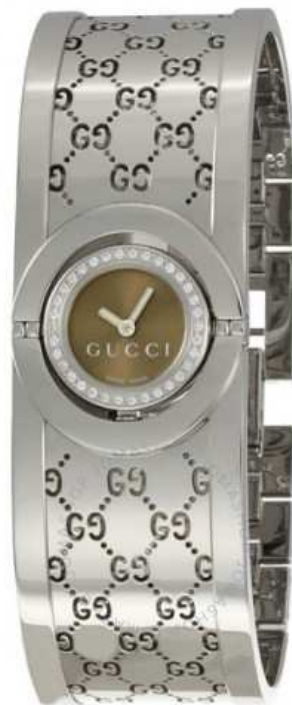
TWIRL YA112503 VENDIDO