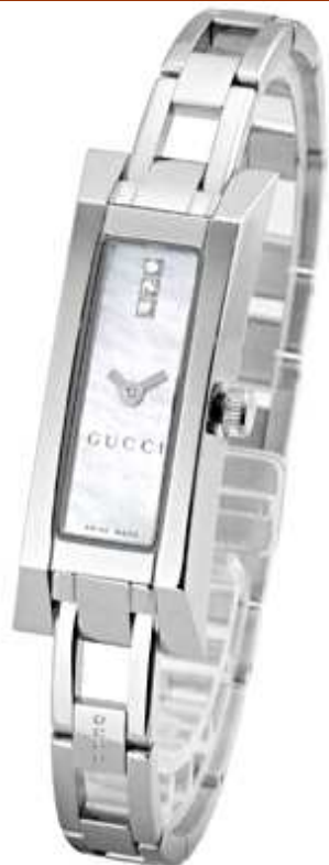
G LINK YA110516 Cuarzo - Acero Con 3 diamantes en esfera nacarada