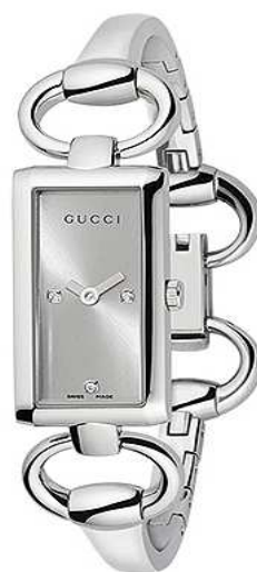
TORNABOUNI YA119504 Cuarzo - Acero Con 3 diamantes en esfera