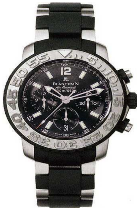
Fifty Fathoms Air Command