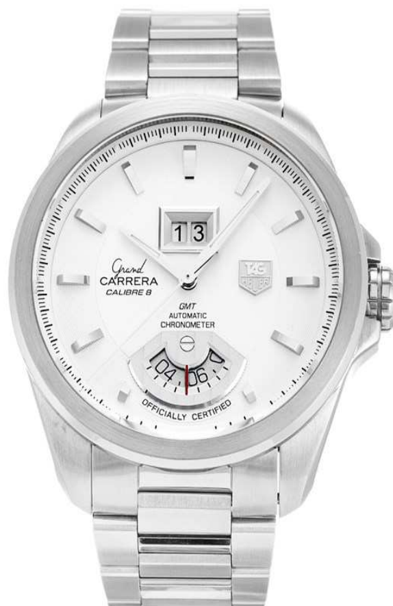
GRAND CARRERA GRANDE DATE GMT WAV5112.BA0901

Movimiento automático calibre 8 RS - Certificado C.O.S.C - Cristal zafiro - GMT Estanqueidad 100m - Caja acero 42'5mm - Brazaletes acero con cierre desplegable Reserva de marcha 42 horas