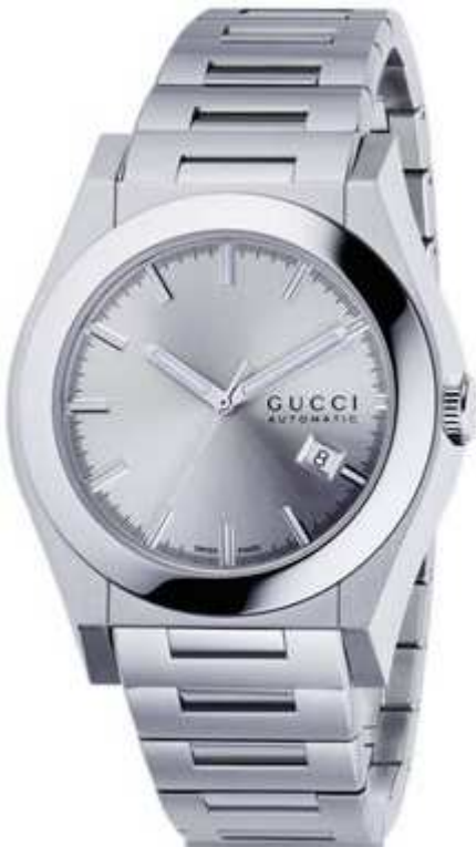
PANTHEON XL YA115202

Cuarzo - Digital Acero - GMT - Alarma- Crono € 930,00